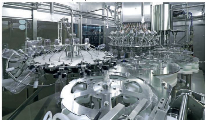
Чистая камера мультиблока/ Clean Room of the multibloc