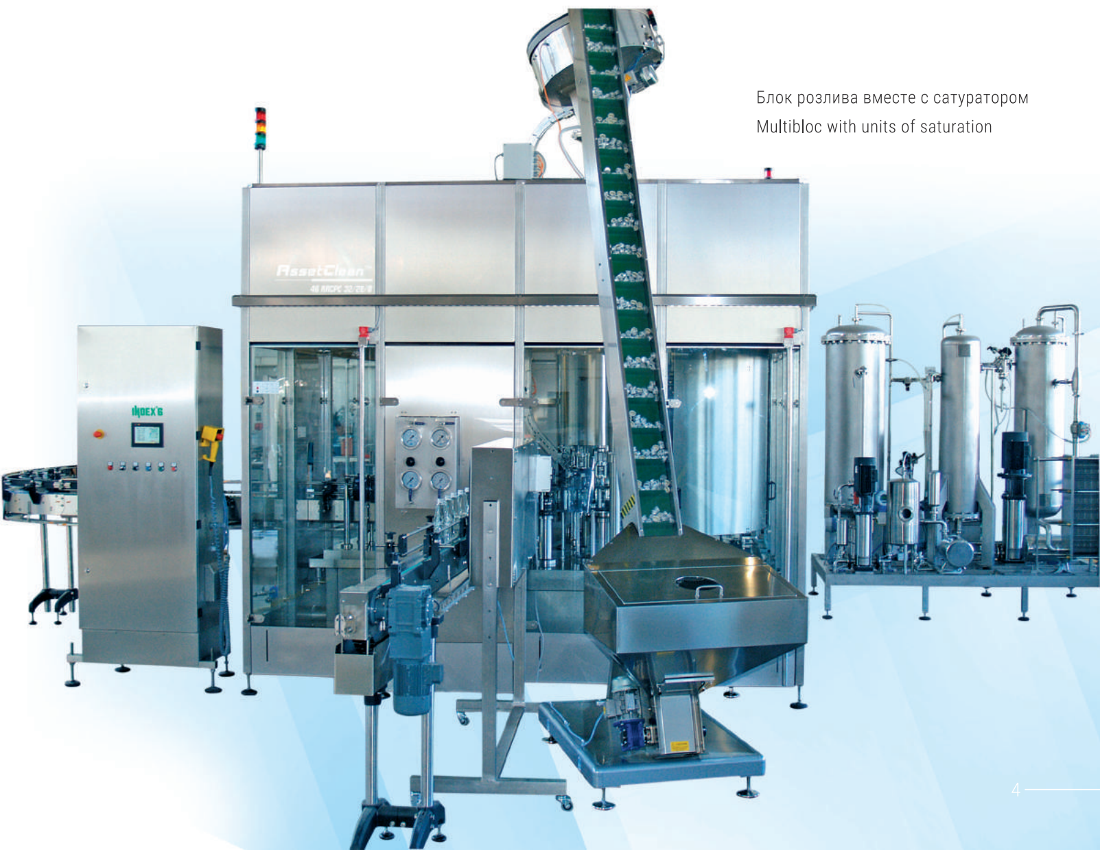
Блок розлива вместе с сатуратором Multibloc with units of saturation

Capping section with linear orientation devise for the caps with Pick & Place system and capping heads with hysteresis torque adjustment, or with threading heads depending on the type of caps.