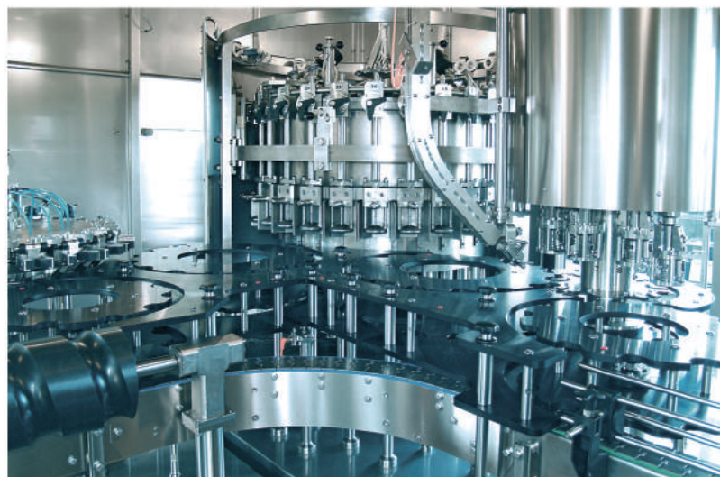
Чистая камера мультиблока/ Clean Room of the multibloc